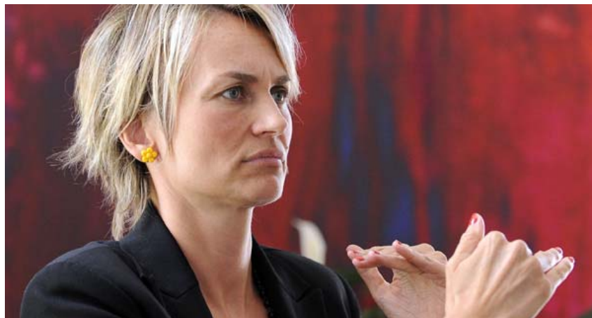
Helene Jarmer ist die einzige gehörlose Abgeordnete - für viele Betroffene ist das Studium eine große Hürde

"GESTU", das Uni-Projekt für gehörloses Studieren, soll zumindest in Wien bis 2015 verlängert werden. Nach wie vor gibt es an den heimischen Universitäten zahlreiche Hindernisse für Gehörlose – das Projekt geht dagegen an.